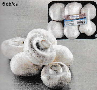
Csiperkegomba 6 db/cs