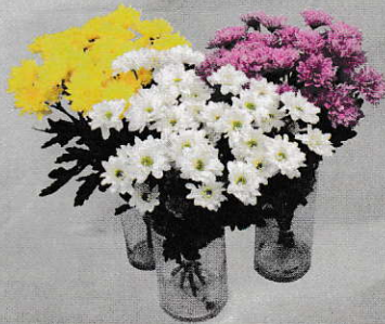
Krizantém 5 szálás