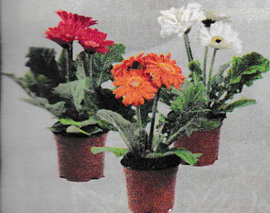
Gerbera 9 cm-es