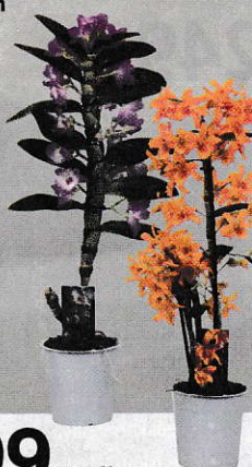
Dendrobium 12 cm-es